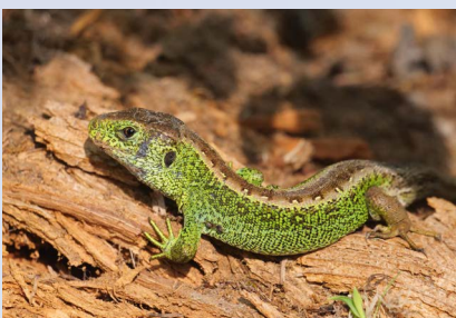
Dank gezielt geschaffenen Strukturen konnte sich die Zauneidechse im Meggerwald ausbreiten.

Interview: Thomas Langenegger Fachverantwortlicher Kommunikation