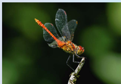
Neu geschaffene Gewässer kommen Amphibien und Libellen, wie hier der Blutrote Heidellibelle, zugute.